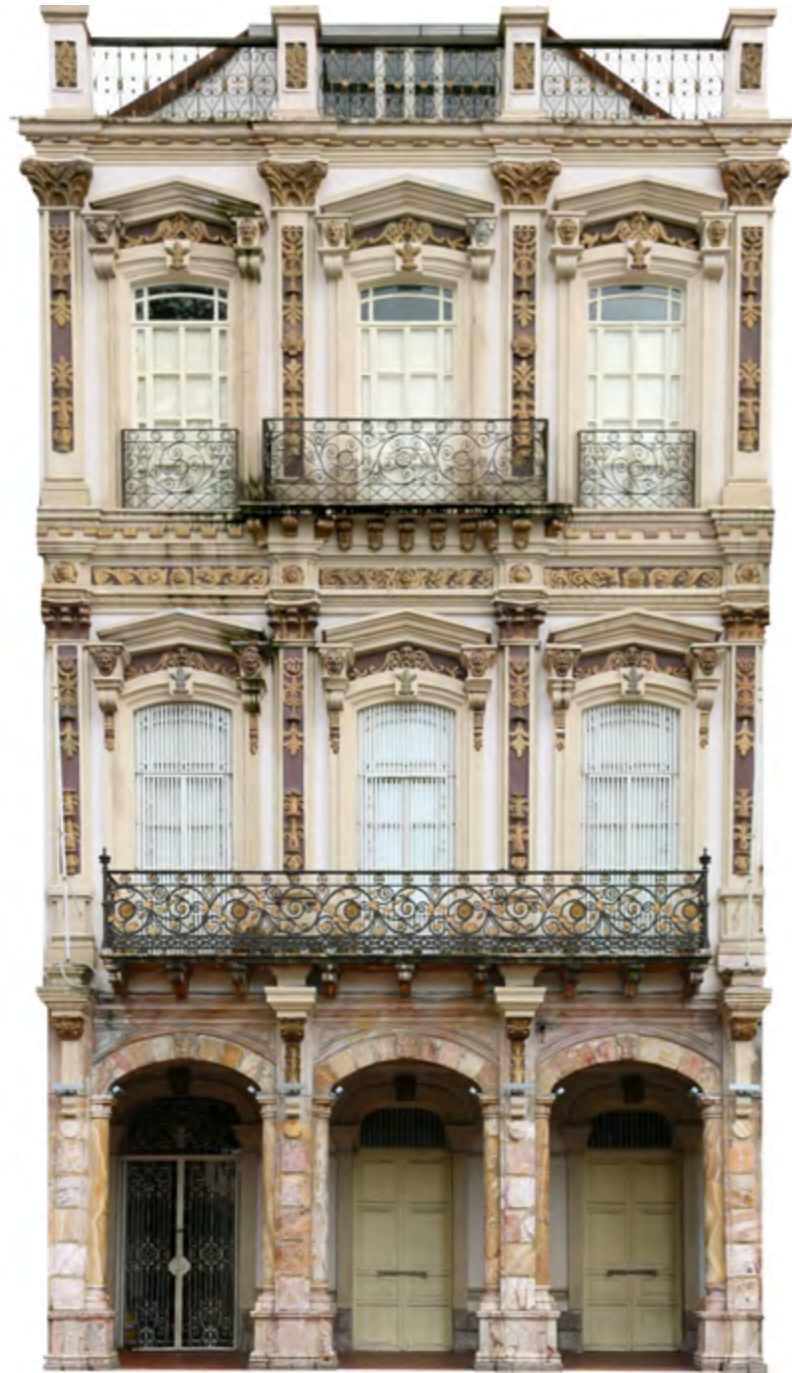
Estilo neoclásico francés en Cuenca, Bolívar 8-28 entre Luis Cordero y Benigno Malo