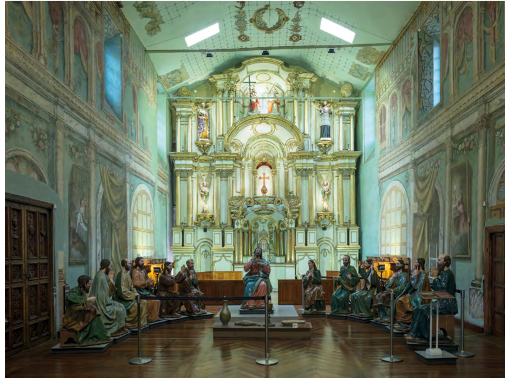
Última cena, grupo escultórico de José Miguel Vélez en el altar de la Catedral Vieja.

Desde el año 2011 no se ha hecho que se entregue esa plata; en los presupuestos de la Municipalidad de Cuenca no aparece nunca un fondo que diga 5 millones porque es una renta permanente que se actualiza de acuerdo a la propia ley con el deflactor del Producto Interno Bruto, que es más o menos la inflación.