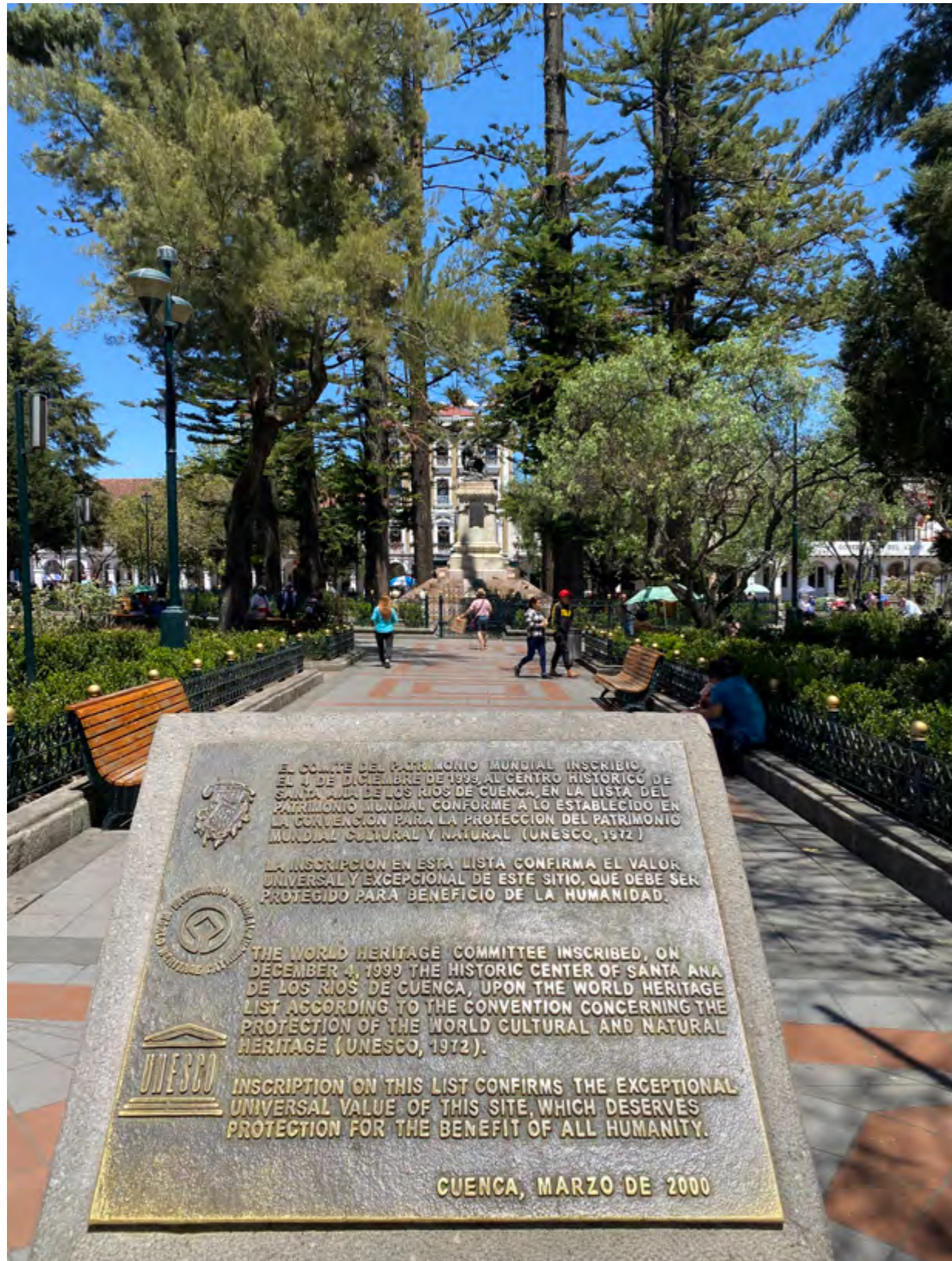
Placa que refrenda la condición de Patrimonio Cultural de la Humanidad de Cuenca, Parque Calderón.