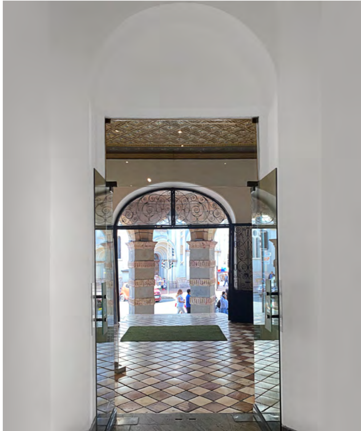
Galería de la Alcaldía, antiguo Banco del Azuay, calles Borrero y Sucre.