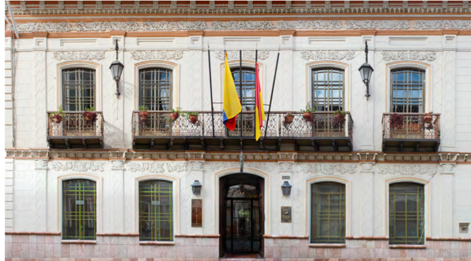
Estilo neoclásico francés en Cuenca, Bolívar 12-55 entre Juan Montalvo y Tarqui