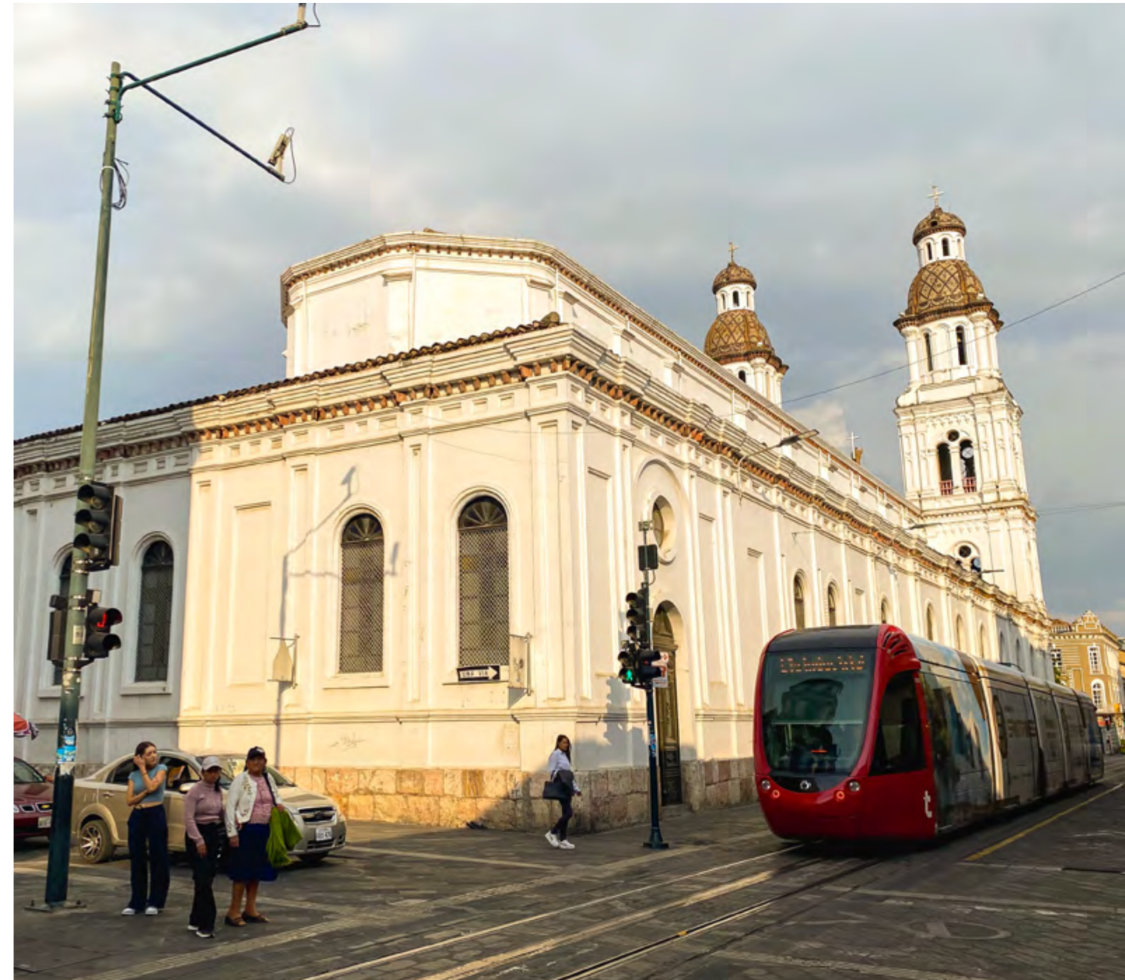
Iglesia de Santo Domingo, calles Gran Colombia y General Torres.

En una investigación realizada por el arquitecto Carlos Jaramillo et al., en 2014, se demostró que en los últimos años han sido notorios los problemas a los que han tenido que enfrentarse gestores de ciudades patri-