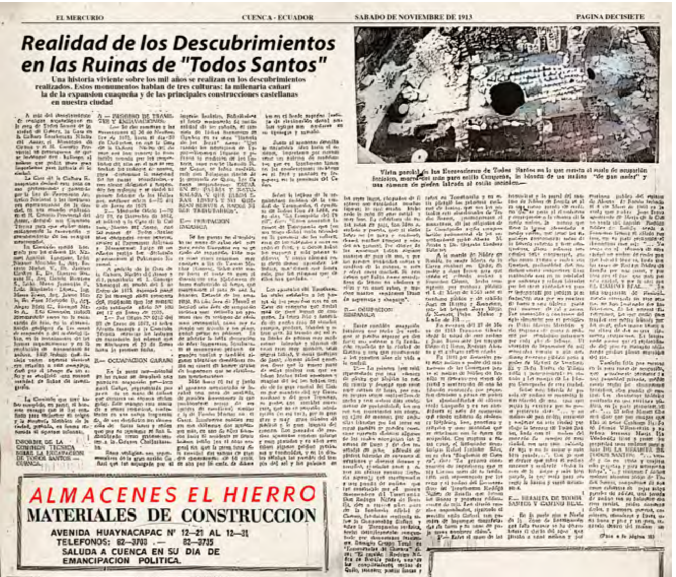
«Realidad de los descubrimientos en las ruinas de Todos Santos», diario El Mercurio, 3 de noviembre de 1973

sin embargo, el alcalde comentó que el Municipio no contaba con recursos para este tipo programas, dejando ver que no se disponía de fondos destinados al estudio, difusión y conservación del patrimonio en la ciudad.