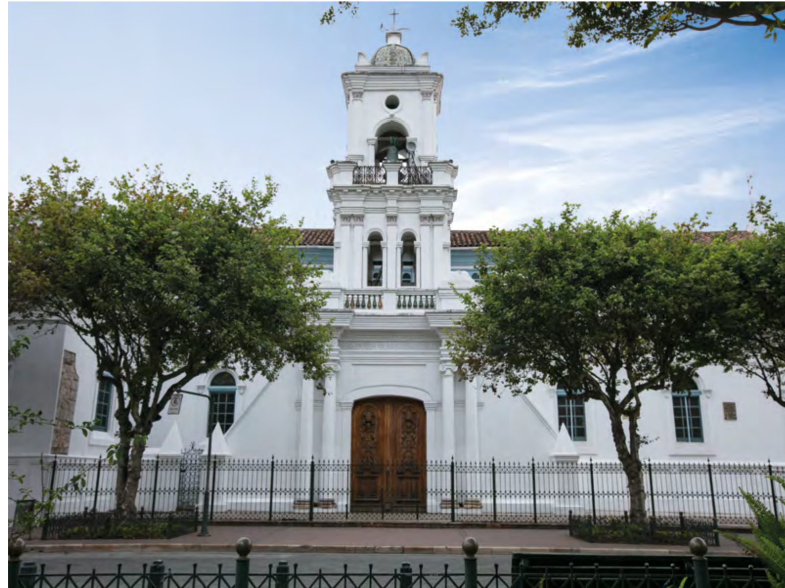
Fachada de la antigua Catedral, hoy Museo de Arte Religioso Catedral Vieja.

Recientemente le dije al alcalde que hay que pensar en el corazón de la ciudad y a lo mejor haya que peatonalizar las calles en el centro. Será un tema polémico, como fue polémico cuando en mi alcaldía hicimos las calles más estrechas para los carros y las veredas más grandes; me dijeron de todo, incluso que estaba destruyendo el patrimonio. Creo que esa falta de un plan