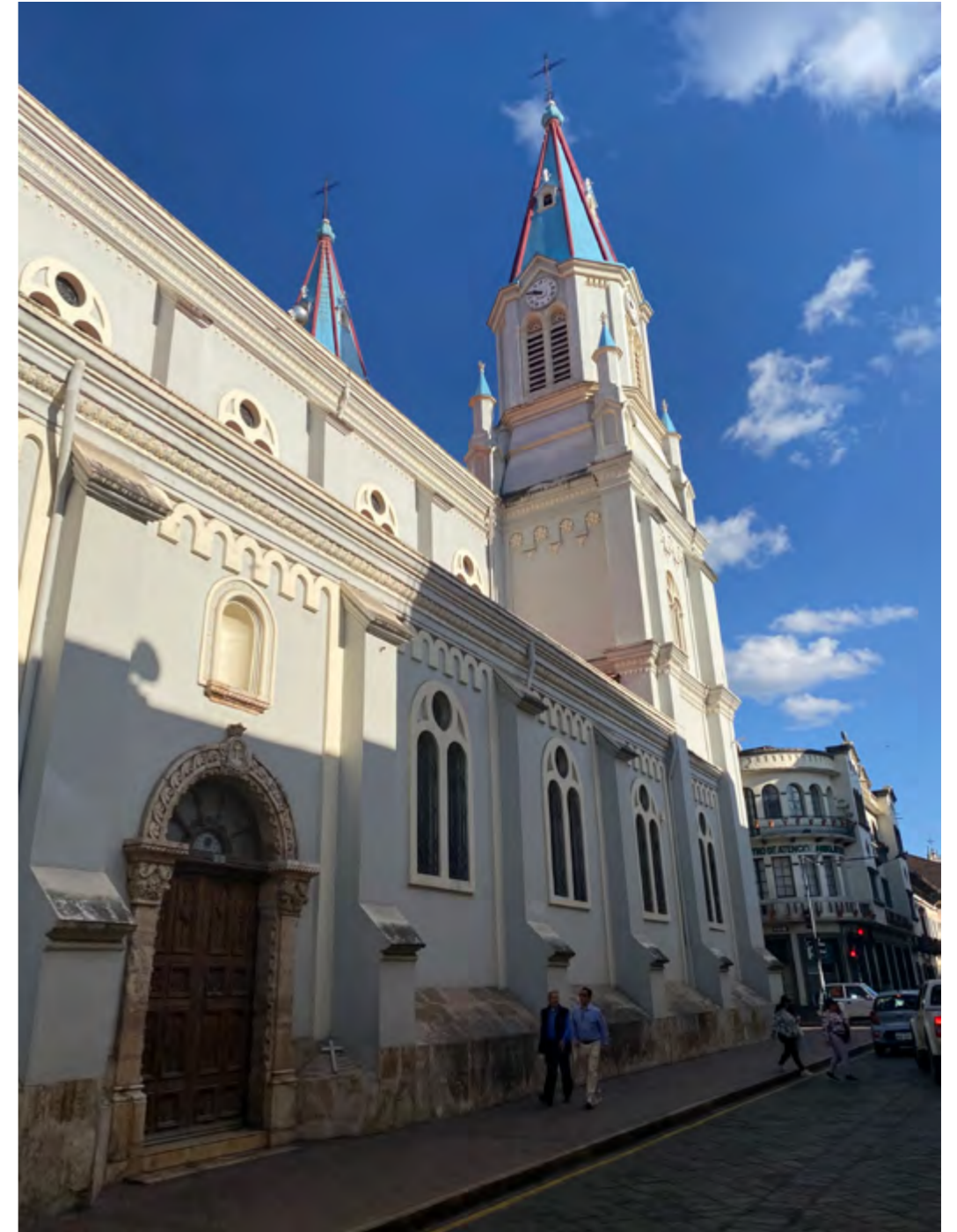
Iglesia de San Alfonso, calles Borrero y Sucre.