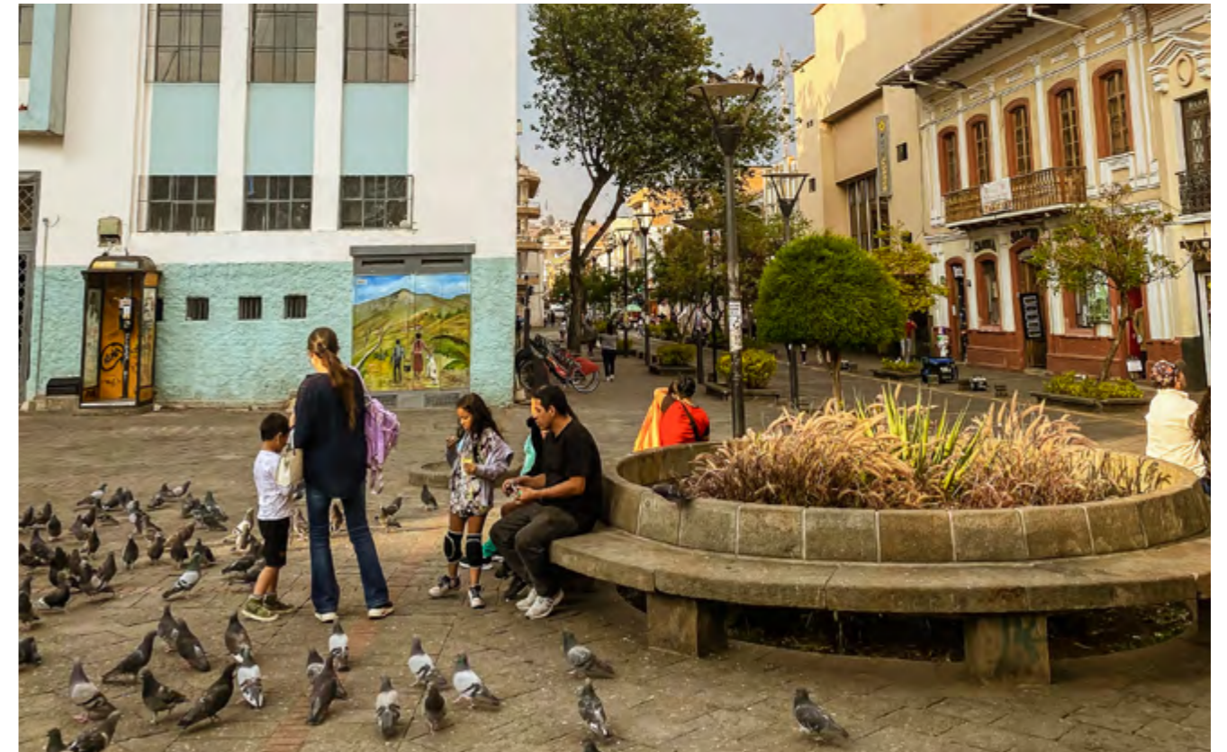
Plazoleta de Santo Domingo.

Hoy, la verdadera tarea, tras 25 años de la declaratoria, es reconocer que la idea de patrimonio ha dejado de ser un concepto asociado a la propiedad privada o individual, para convertirse en un símbolo de identidad colectiva. La forma en que podemos asegurar la conservación de estos bienes a lo largo del tiempo es ampliando la lista de valores con la participación activa de los ciudadanos. No debemos esperar nuevamente a la creación de una Junta Cívica que luche por lo que pertenece a toda la humanidad; sobre todo, debemos recordar que este patrimonio es nuestro, de los cuencanos que estamos preocupados por el destino de nuestra ciudad.