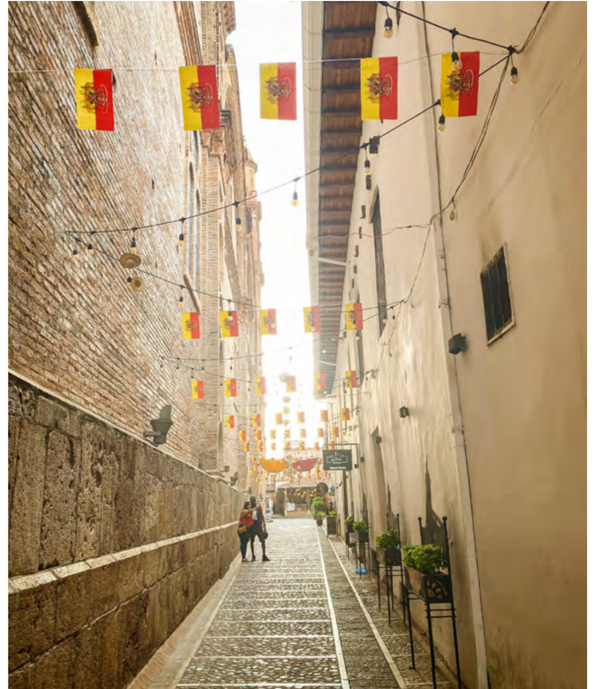
Calle Santa Ana.