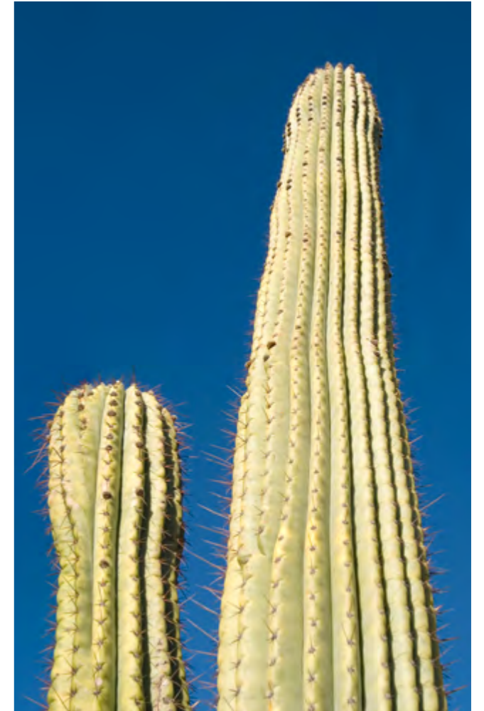
Aguacolla o cactus

Hay mucho más por escribir, pero por el momento aquí queda mi relato.