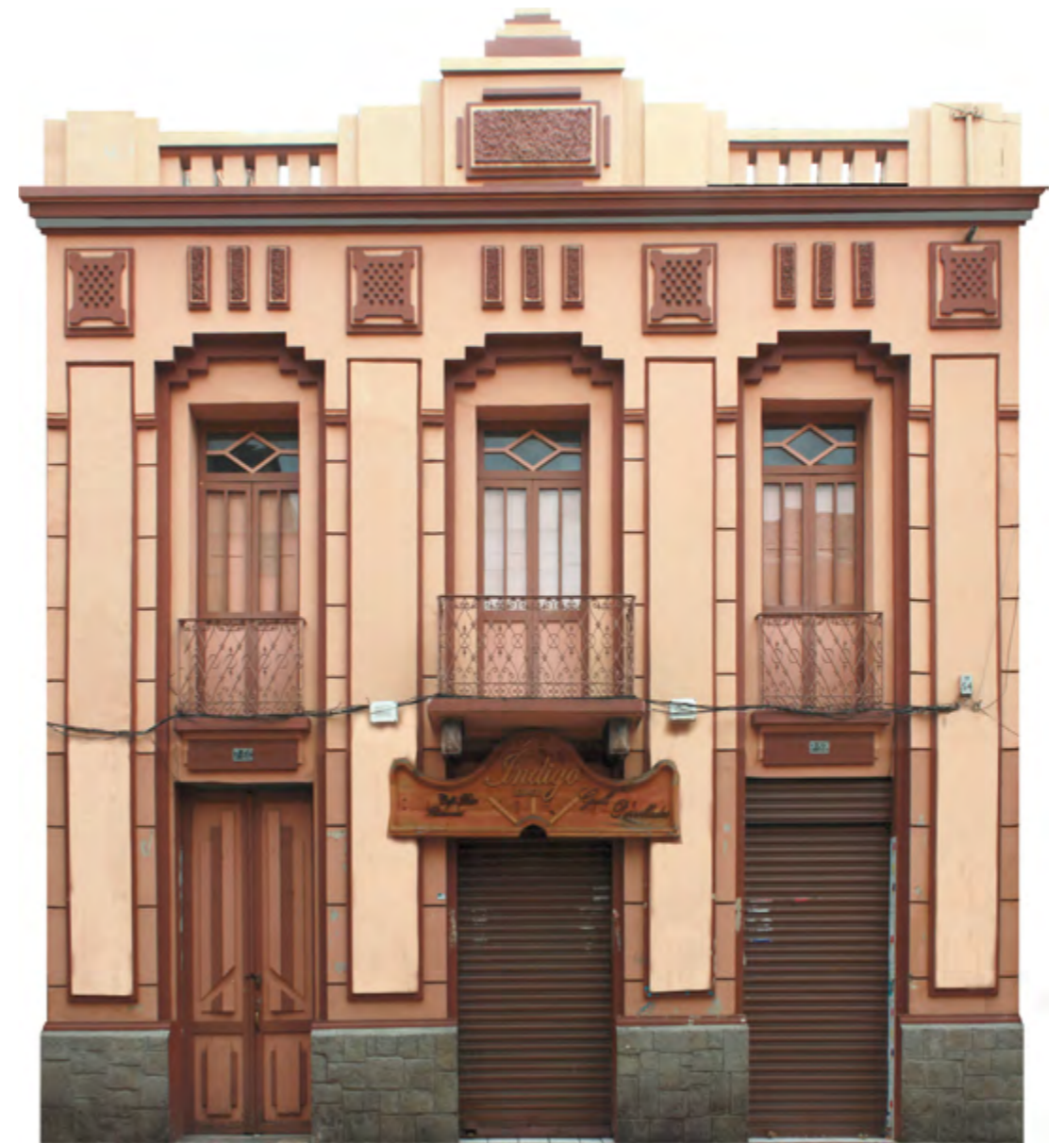
Estilo art déco en Cuenca, Borrero 7-60 entre Sucre y President Córdova