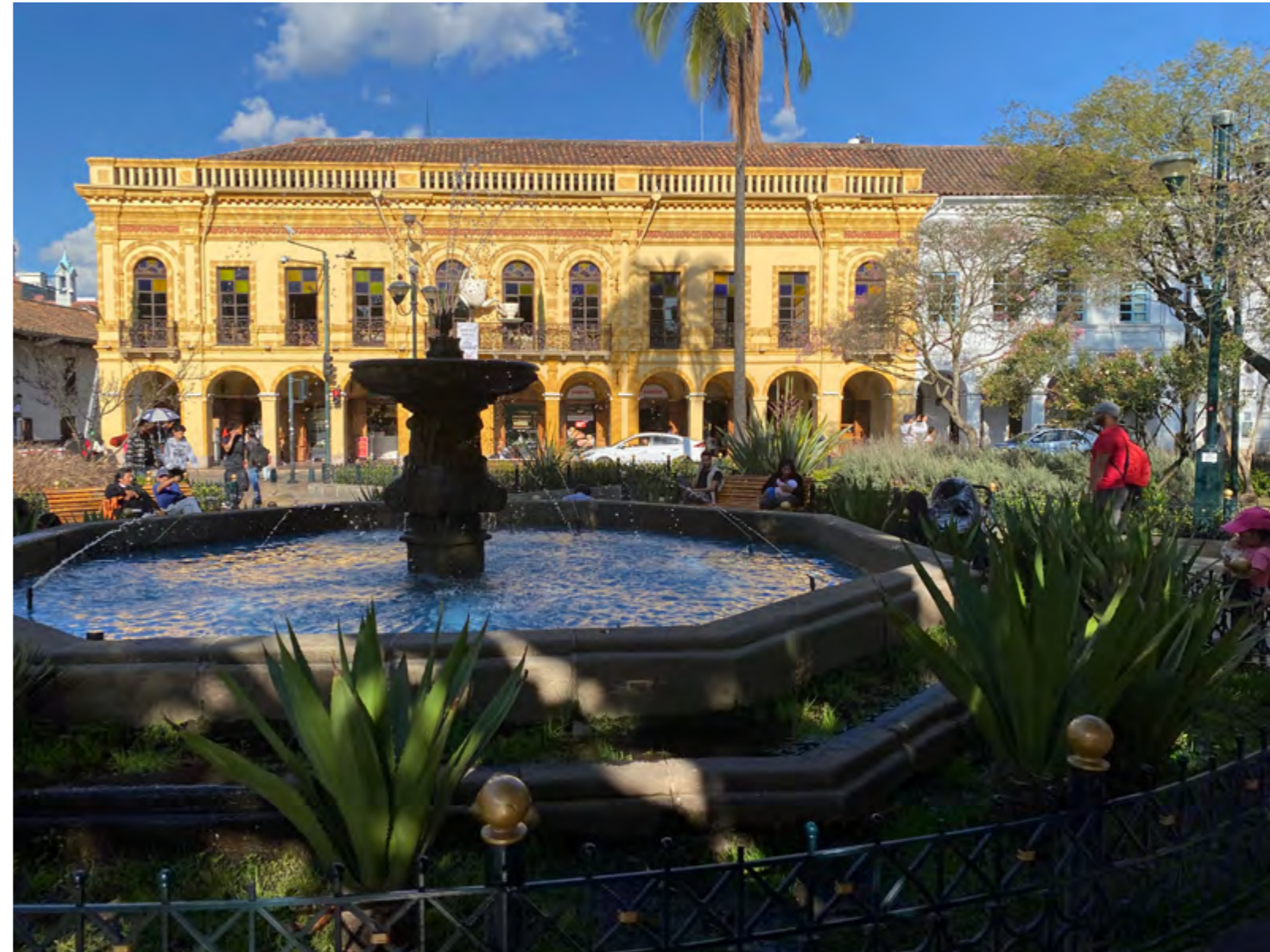
Pileta del Parque Abdón Calderón.

En las perspectivas contemporáneas, es esencial evaluar las construcciones discursivas y políticas del patrimonio para entender las políticas de patrimonialización y memoria, así como los usos y conflictos