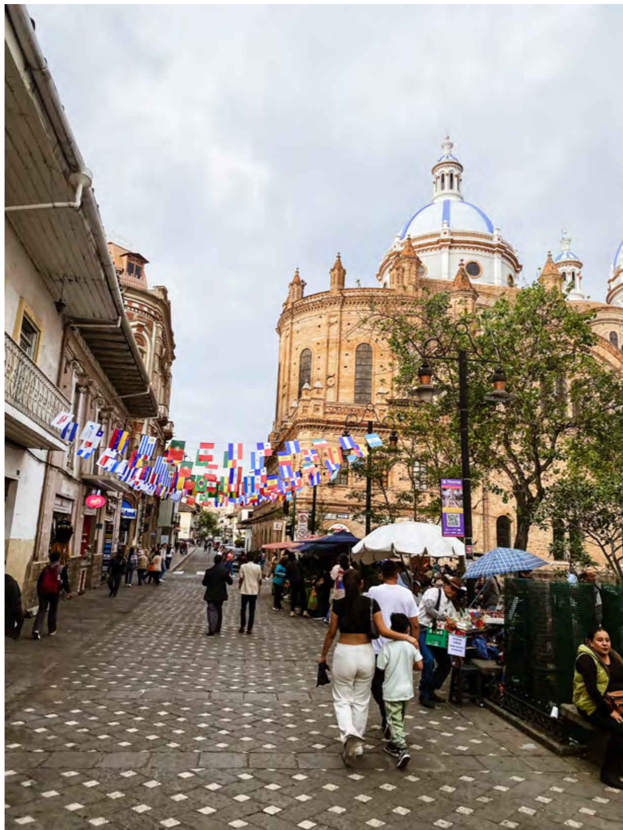
La Catedral desde la calle Padre Aguirre.