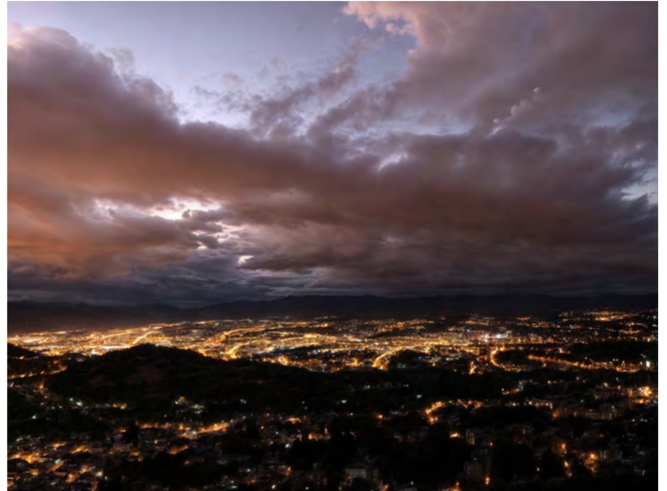
Vista de la ciudad de Cuenca desde uno de sus cerros sagrados.