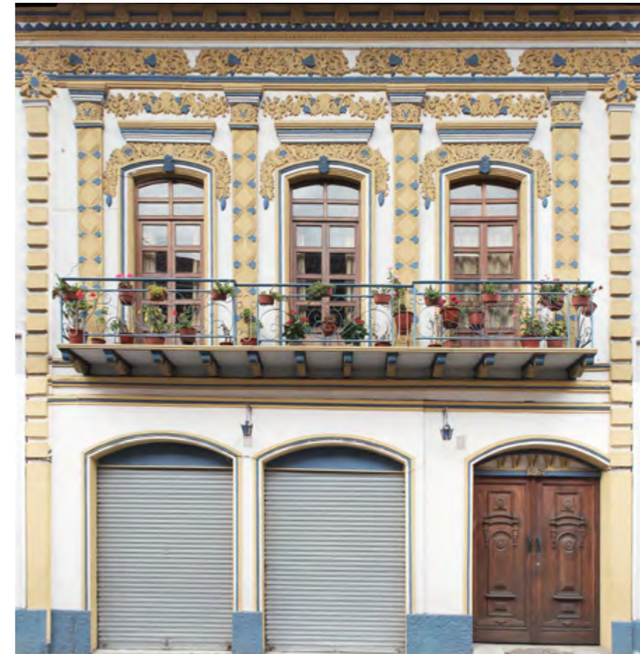
Estilo ecléctico en Cuenca, Bolívar 12-69 entre Juan Montalvo y Tarqui