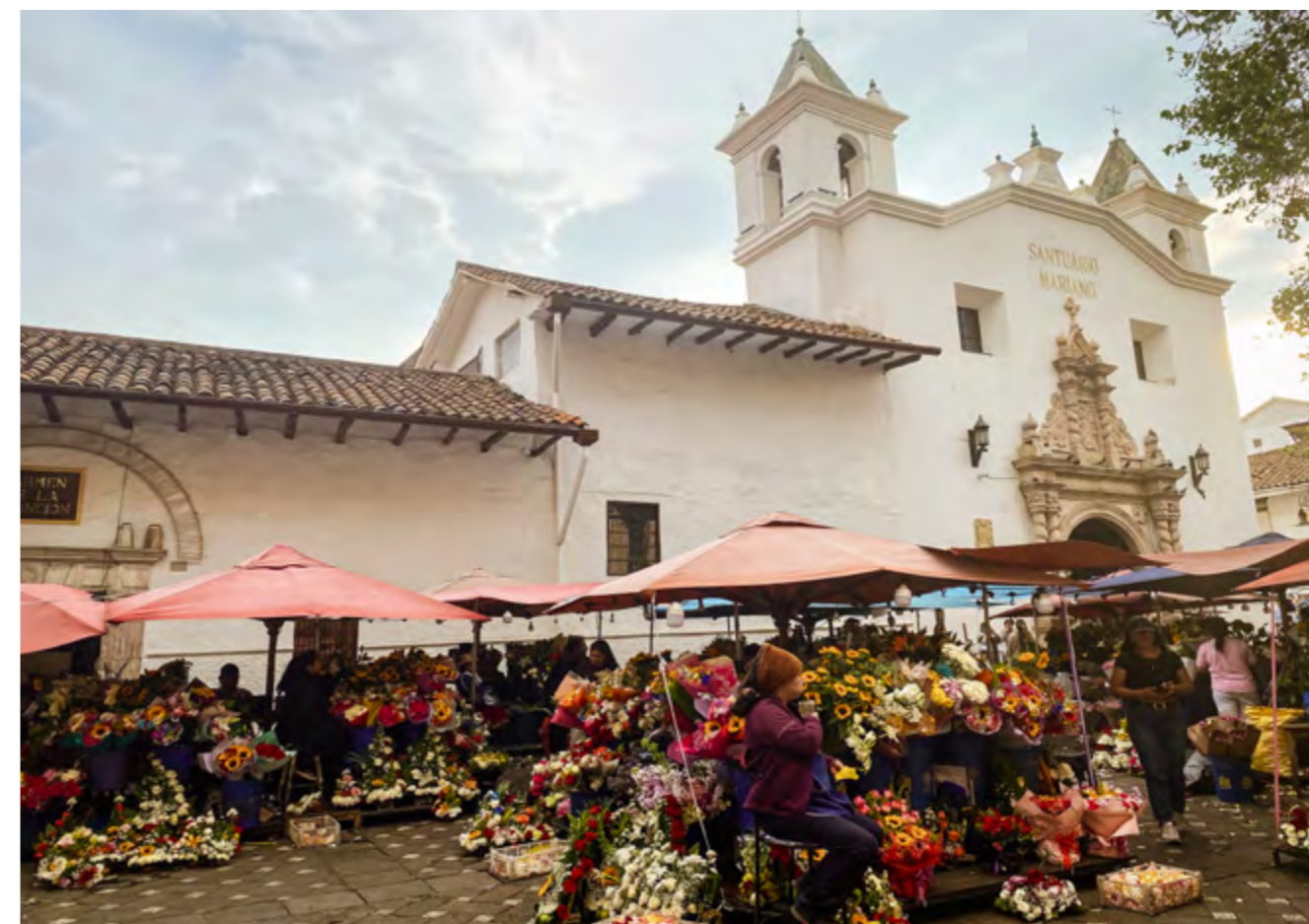
Parque de la Flores, al fondo iglesia del Carmen.