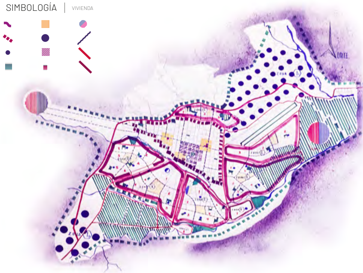
Plan de Desarrollo Urbano-Cuenca 1968-1980. Esquema Funcional de la Ciudad.