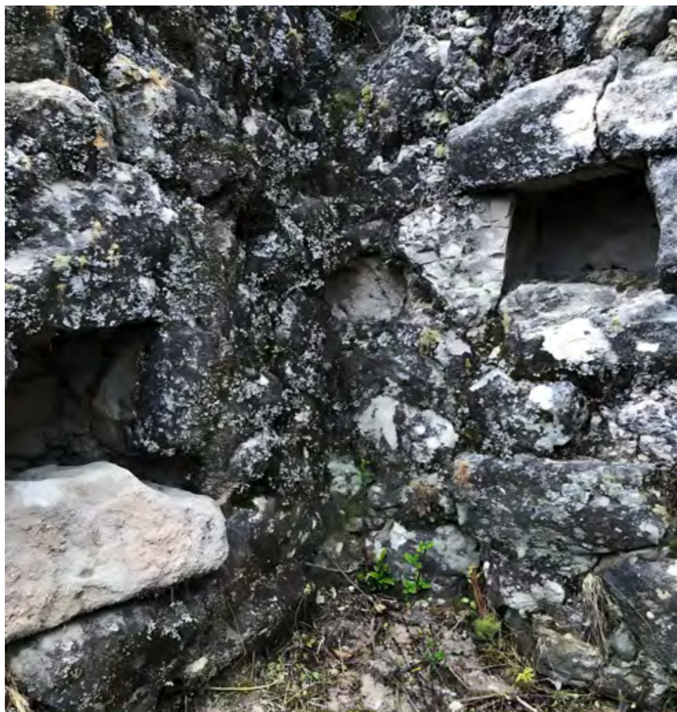
Estructura de piedra en el cerro Guagualzhumi. Equipo investigador, 2022

la región, subrayando cómo han sido, a lo largo de los siglos, escenarios de rituales, mitos y prácticas comunitarias que fortalecen el sentido de pertenencia y continuidad histórica.