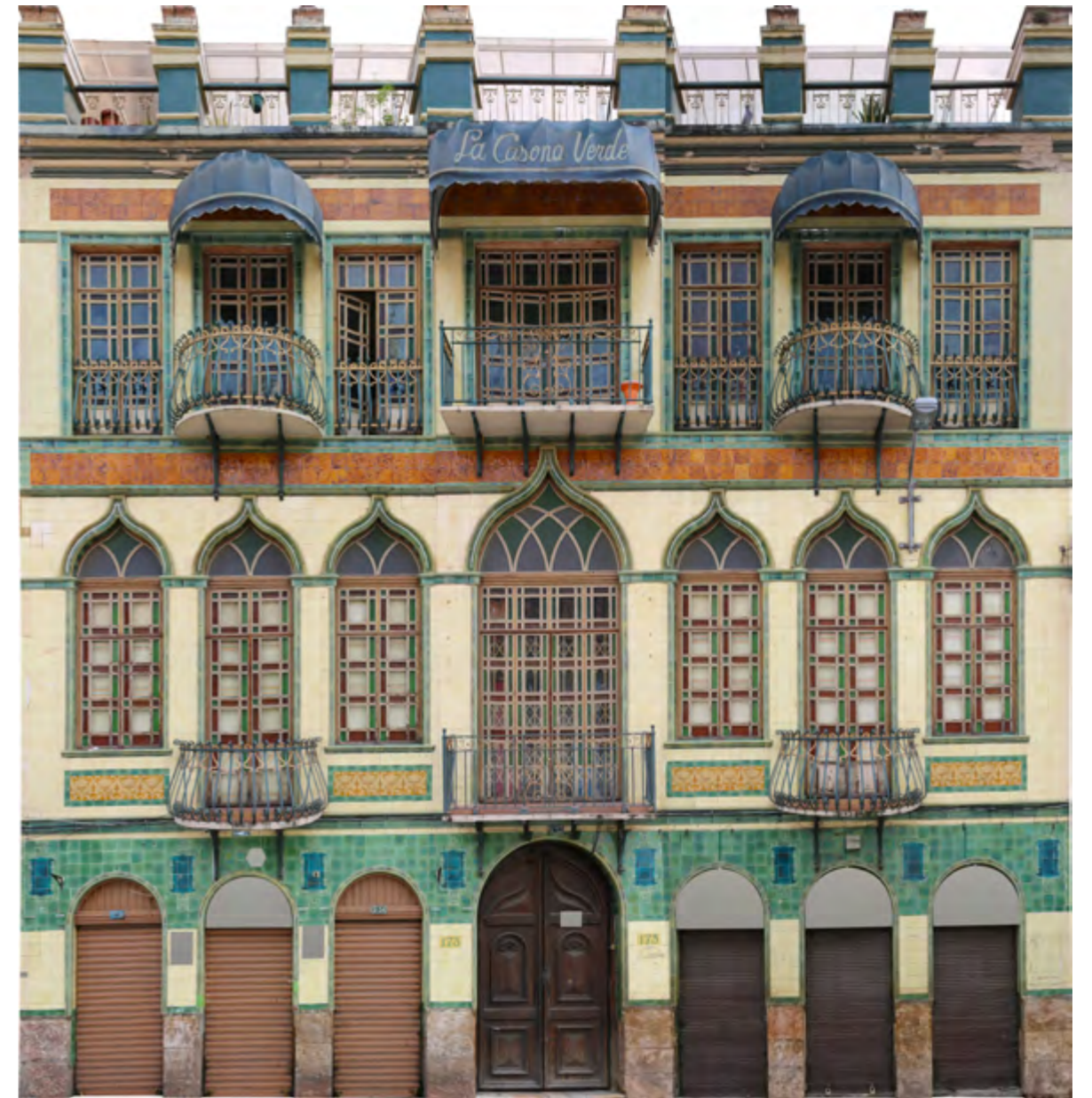
Estilo art nouveau en Cuenca, Bolívar 9-52 entre Padre Aguirre y Benigno Malo