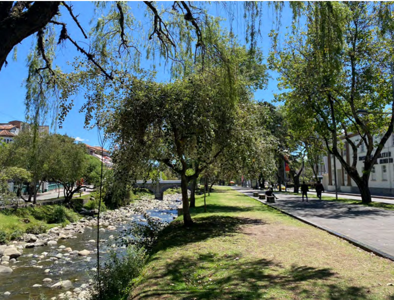
El Tomebamba frente al Hospital Militar.