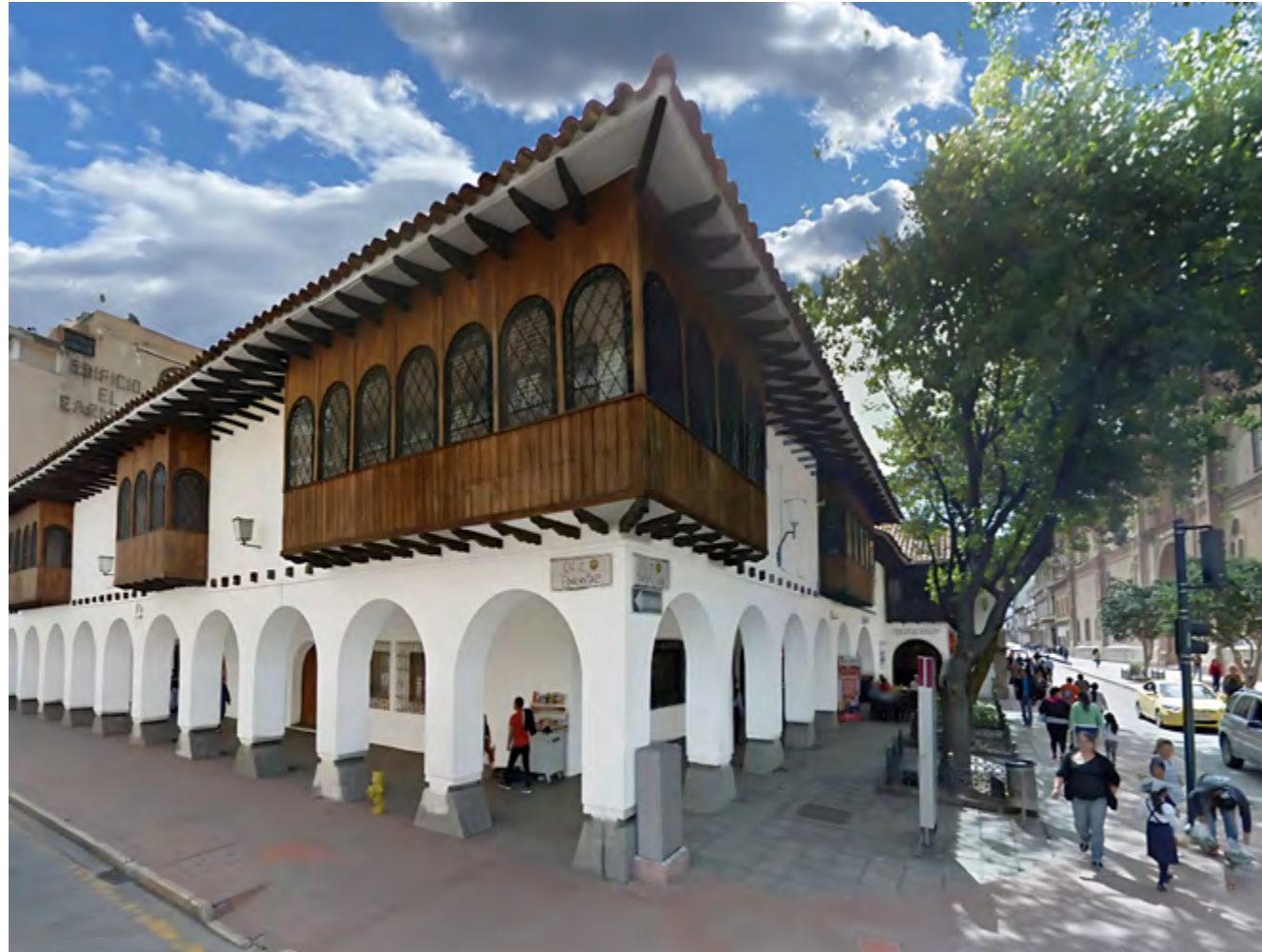
Edificio ganador de la preselección Gil Ramírez Dávalos en 1971, obra de Patricio Muñoz Vega. Esquina de las calles Sucre y Benigno Malo.