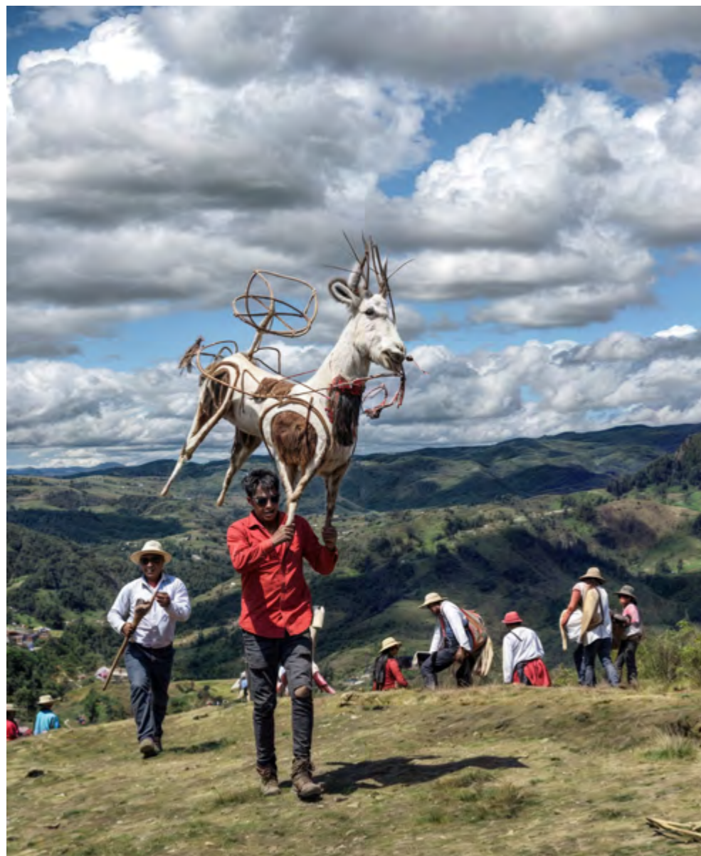
Portador de la «vaca loca» abriendo el baile en la cima del cerro Curitaqui. Equipo investigador, 2022

Al llegar, se celebra una misa en honor a la Santa Cruz. Tras la ceremonia religiosa, los sacerdotes ofrecen una comida comunitaria que incluye cuy, pollo, papas, arroz y la infaltable chicha de jora (bebida ancestral hecha de maíz). Una vez culminado el almuerzo, un joven de la comunidad se encarga de encender la pirotecnia y dar vida a la «vaca loca», proporcionando entretenimiento a los asistentes. Además, en este evento se elige a los sacerdotes que se encargarán de organizar la festividad el próximo año, asegurando la continuidad de una tradición que ha perdurado en el tiempo.