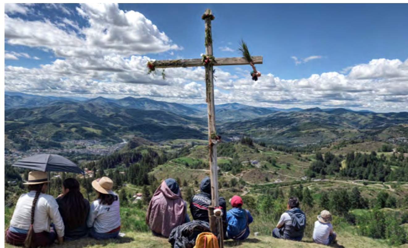
Habitantes de Paccha en la cima del cerro Curitaqui, Equipo investigador, 2022

En el flanco nororiental del Guagualzhumi se encuentra el Curitaqui, cuyo nombre en kichwa significa «cueva de oro» ( curi = oro, taqui = cueva). Este cerro resguarda una rica cultura material, evidente para quienes lo ascienden. En particular, destaca una cueva que ha sido el centro de numerosas leyendas. Entre ellas, se dice que la cueva conecta el Curitaqui con el Cerro Cojitambo, o que es el hogar de la mítica Mama Huaca. Según Astudillo (2022), el Curitaqui forma parte de una secuencia de cerros míticos considerados santuarios de altura. Además, menciona la laguna Quituiña, ubicada en las laderas del Guagualzhumi, a la que algunos autores identifican como el lugar de origen del mito fundacional de los cañaris.