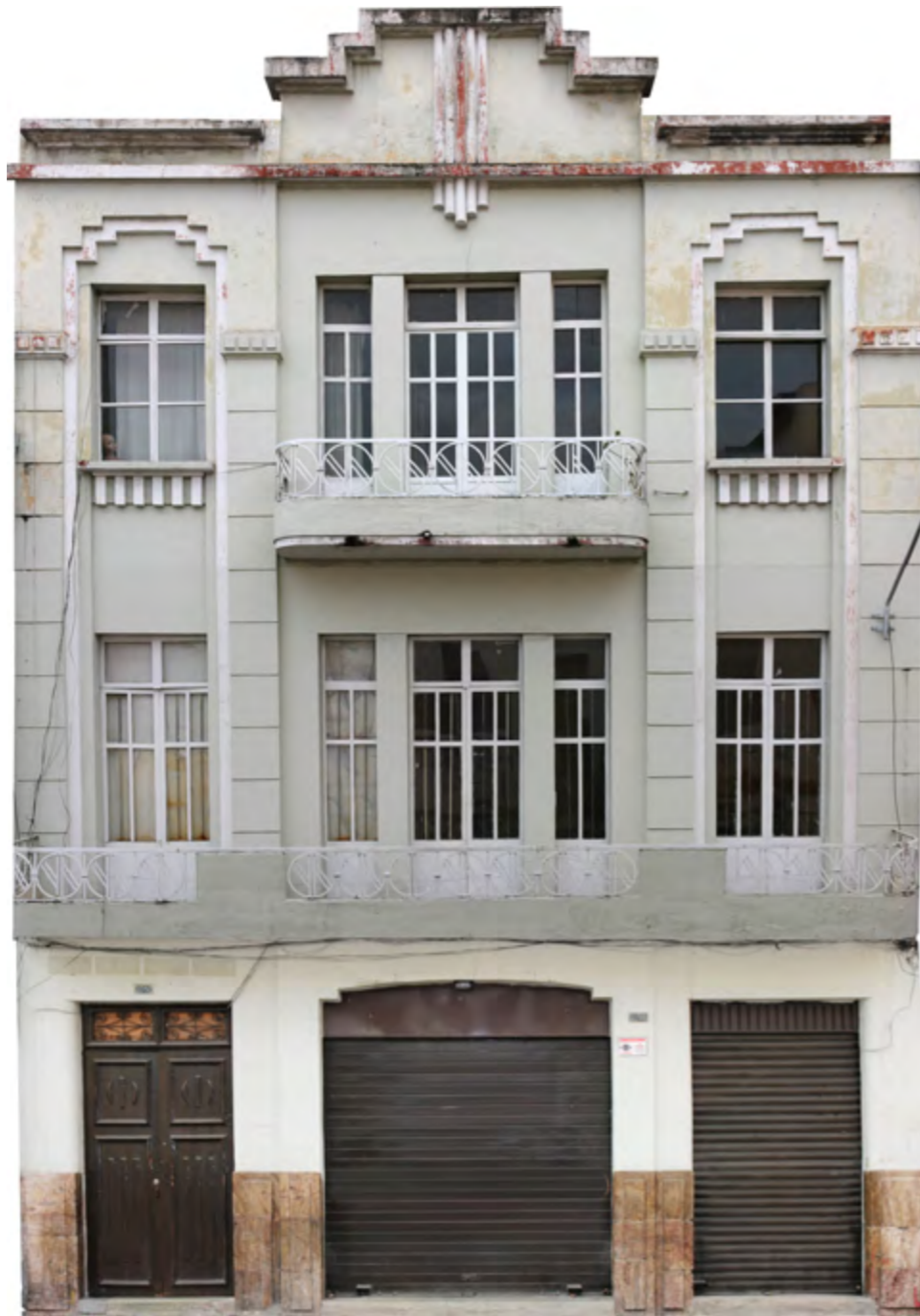
Estilo art déco en Cuenca, Benigno Malo 10-44 entre Gran Colombia y Lamar